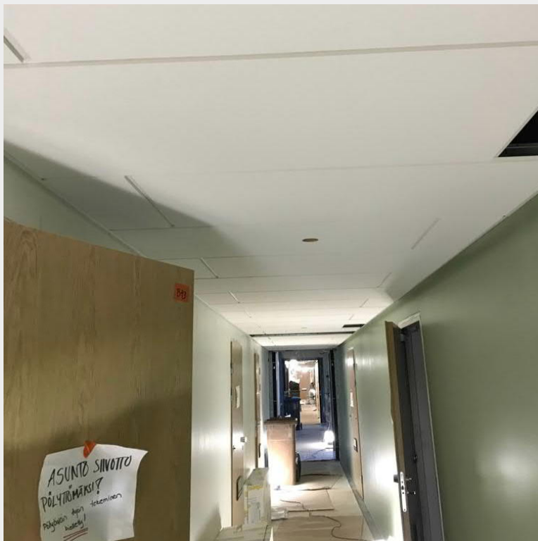
Alakatto asennettuna porrashuoneessa (kuva 22.2.2019).

ULKOPUOLEN TYÖT: Julkisivun luonnonkivitöihin liittyviä kittauksia Parvekeritilätöitä Asuntoterassitöitä Parvekelasiasennuksia Kadun puolen pihatöitä