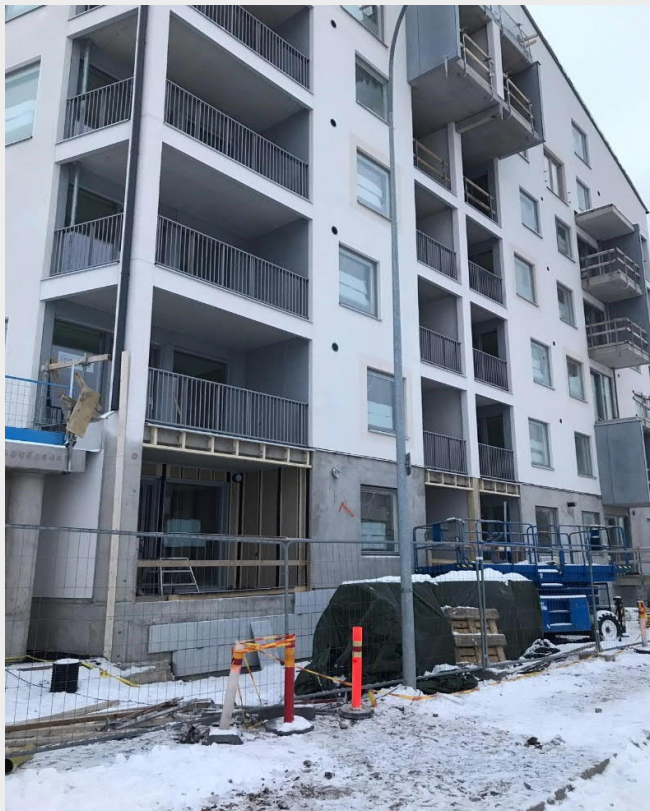
Kadun puolella asennettuna ensimmäisiä parvekekaiteita (kuva 30.11.2018).

Kuluneella viikolla on aloitettu parvekekaiteiden asennukset. Ulkopuolen töiden osalta on jatkettu kannen päälle tulevien asuntoterassien puutöitä, julkisivulevytyksiä, luonnonkivitöitä sekä rappausten viimeistelyjä. Sisäpuolen töitä on myös jatkettu, suurin piirtein viimeisimmän yleisaikataulun mukaisesti.