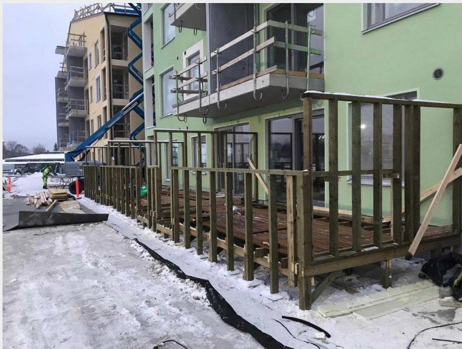
Asuntoterassien puutyöt etenevät B-talon edustalla (kuva 21.12.2018).