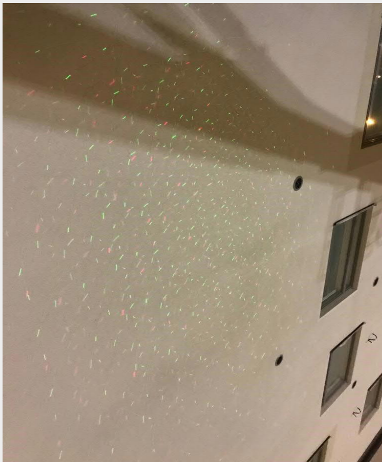
Liikehtivää jouluvalaistusta C-talon seinällä.