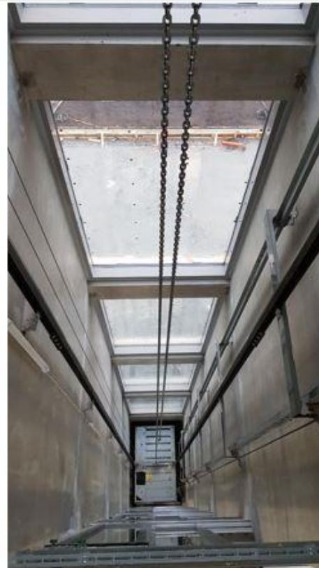
Vasemmalla tänään 30.11. valussa olevat kannelle johtavat portaat. Oikealla hissikuilu kuvattuna ylhäältä lasiseinälle päin. (Kuvat 30.11.2018)