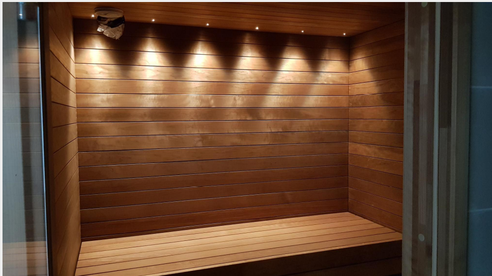
Mallihuoneiston saunatilan led-valaistusta.