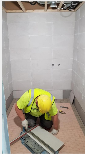
Vasemmalla tasoitettöitä, oikealla kylpyhuoneen laatoituksia.