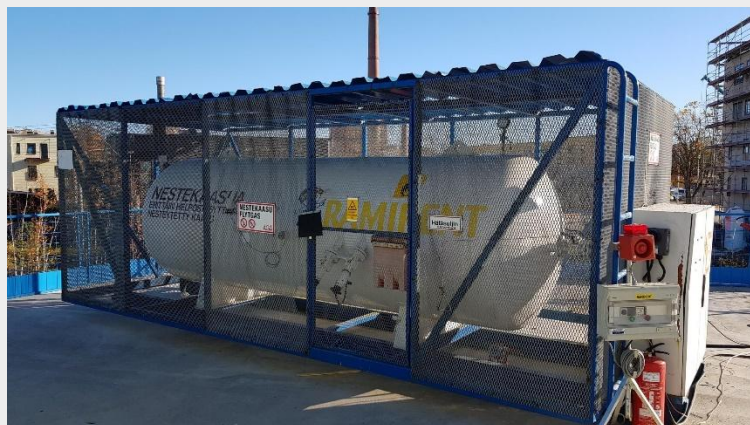
Harppuunakorttelissa otettiin käyttöön (neste)kaasulämmitysjärjestelmä. Tällä ylläpidetään lämpöä aluksi Puosun taloissa, myöhemmin järjestelmä palvelee Majakkaa.