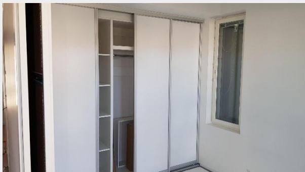
Makuuhuoneen kaapistoa liukuovineen asennettuna.