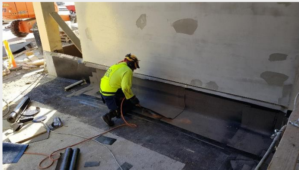
C-talon kannen tason sokkelin kermityöt käynnissä.

Tällä viikolla kerromme Puosun työvaiheista ja tapahtumista valokuvapainotteisesti: