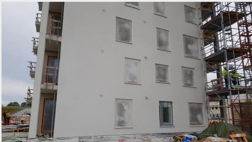
B-talon pohjoispuolen päädyn rappaus on nyt valmis (kuva 27.8.2018).