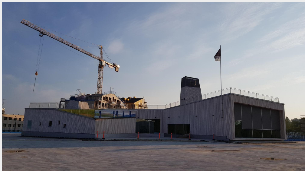
Aamuinen näkymä parkkihallin kansilaatan päältä mainoskontilta korttelitalon ja Puosun työmaan suuntaan. (kuva 3.8.2018)