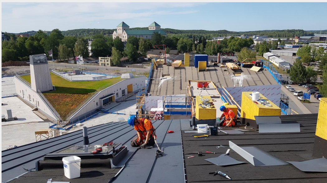
B-talon vesikaton peltitöitä. Taustalla näkyy myös C-talon vesikattoa, johon on nyt asennettu höyrynsulkukermi. (kuva 3.8.2018)

Puurakenteisten parveketaustaseinien työt Betoniseinien hionnat sisällä Ikkuna-asennukset Vesikattoon liittyviä töitä Ulkoseinien etuputsityöt