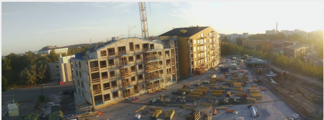
Betonirungot ylhäällä (kuva 18.7.2018)

6.krs katto valettu alkuviikosta Vesikaton höyrinsulkukermin asennus Parveketaustaseinien teko Elementtien saumaustyöt 1. krs Betoniseinien hionta 4. krs Betonipintojen korjaustyöt injektoimalla