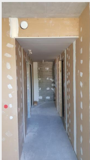
B-talon 2. kerroksen alakatto asennettuna. Ruuvikohtat on tasoitettu kipsilaastilla. (kuva 26.7.18)