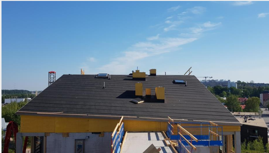
B-talon vesikaton etelänpuoleinen lape. Vesikatto on nyt konesaumapellitystä vaille valmis. Etualalla on tällä viikolla valettu yhdyskäytävän kattolaatta. (kuva 26.7.18)