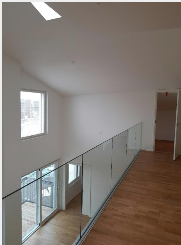
B-talon yläkerroksen huoneisto.