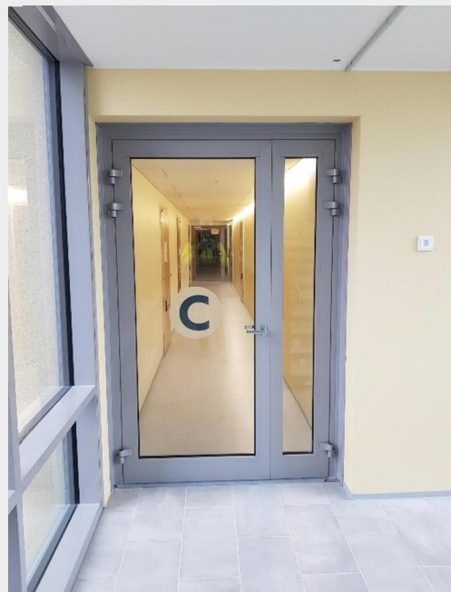
Rakennuskirjainmerkintä kerroksissa talojen lasioivissa.