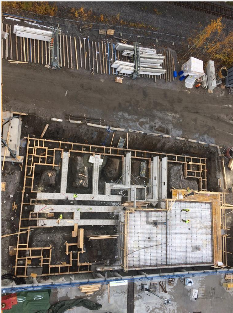
L-talon pohja torninosturi kuvattuna