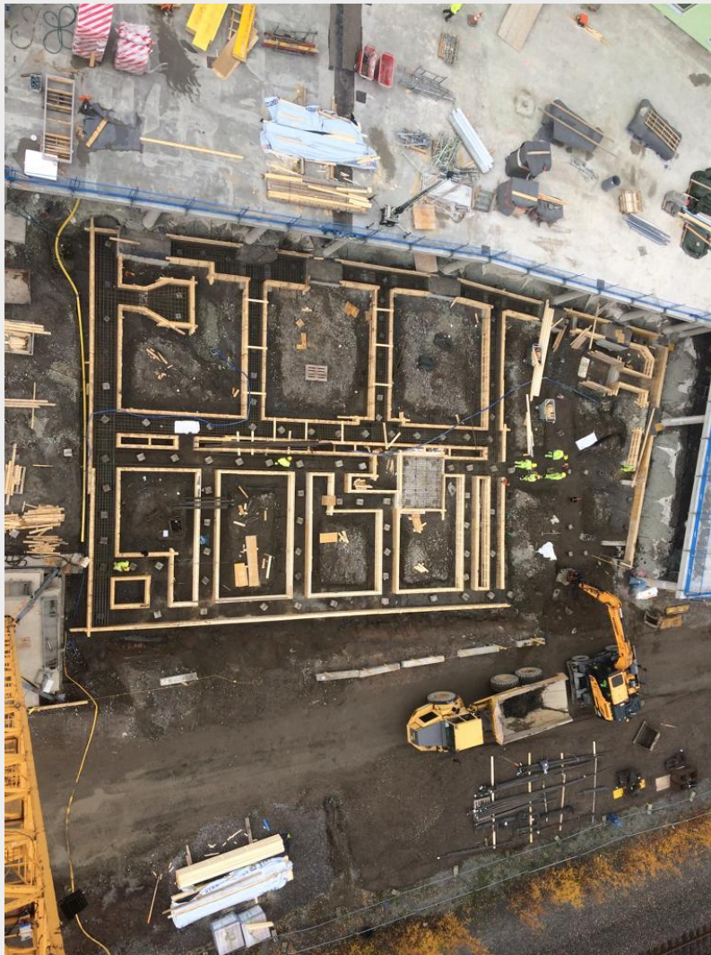
M-talon pohja torninosturista kuvattuna

M-talon nauha-anturoiden laudoitus- ja raudoitustyöt