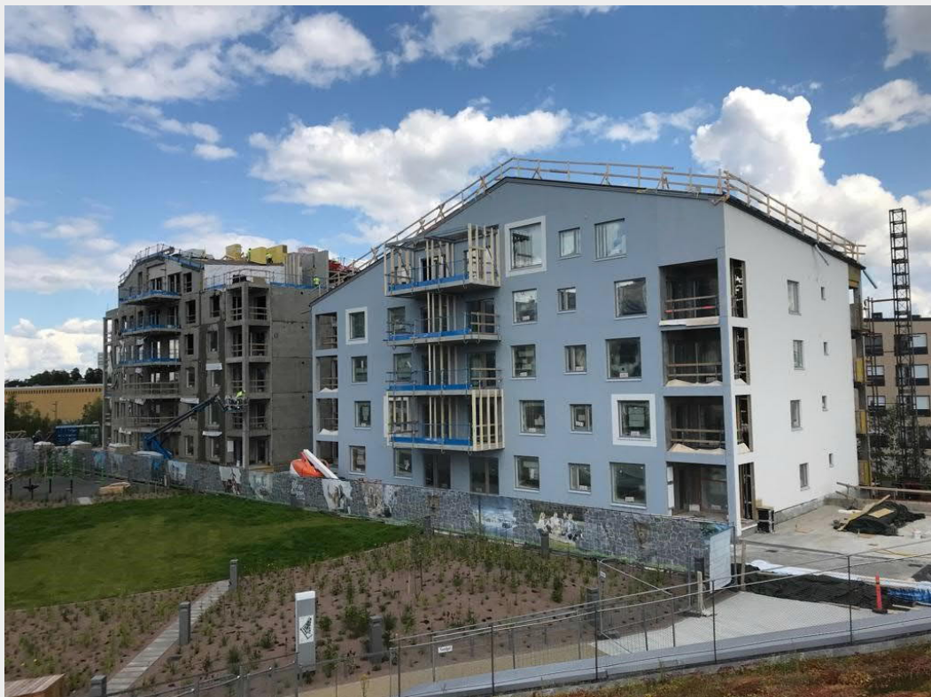
L-talon julkisivurappaus on valmistunut kannen puolen sekä eteläpäädyn osalta (kuva 18.6.2019).