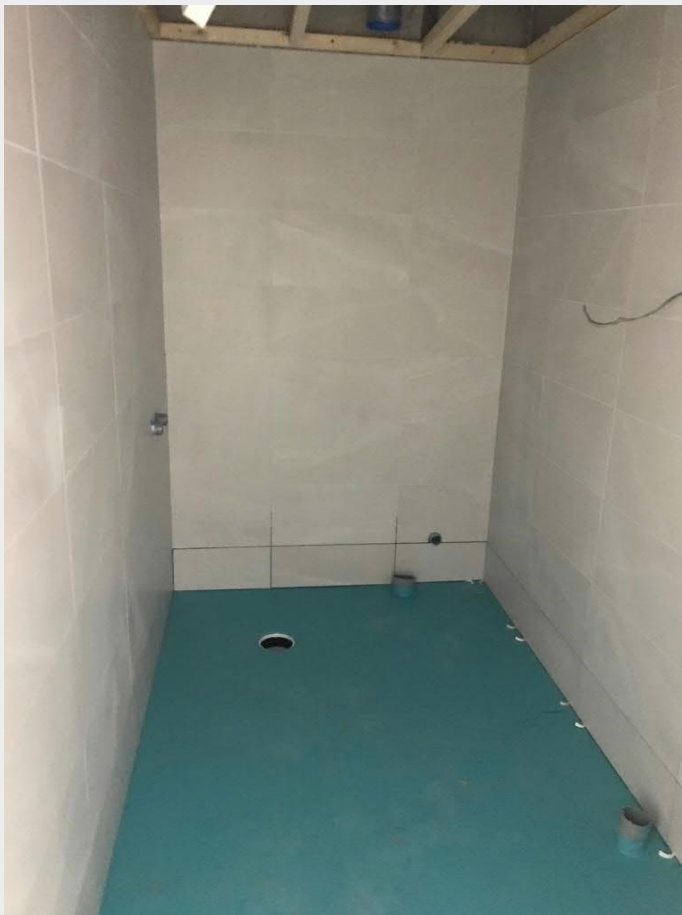
Märkätilan seinälaatoitus valmiina (kuva 19.6.2019).