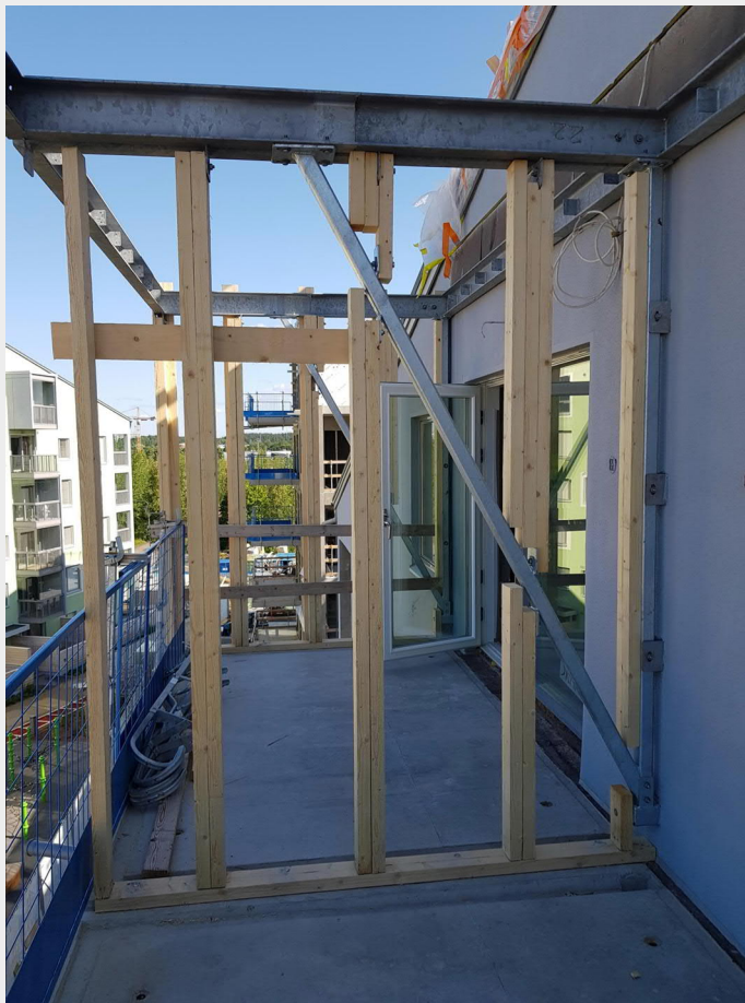
Parvekkeiden puu- ja levytyöt työn alla (kuva 19.6.2019).