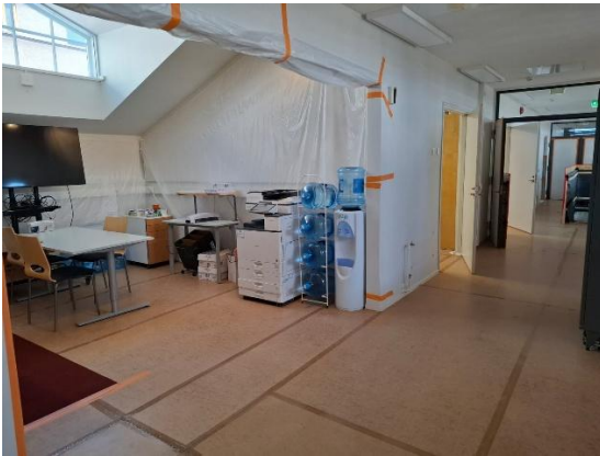
Kuva 3. NCC:n Vaunuvasjan toimistot sijaitsevat 2. kerroksessa