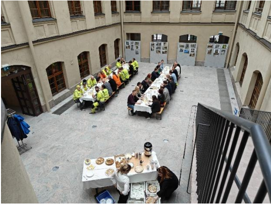
Kuva 1. Halkopihan kahvitilaisuus