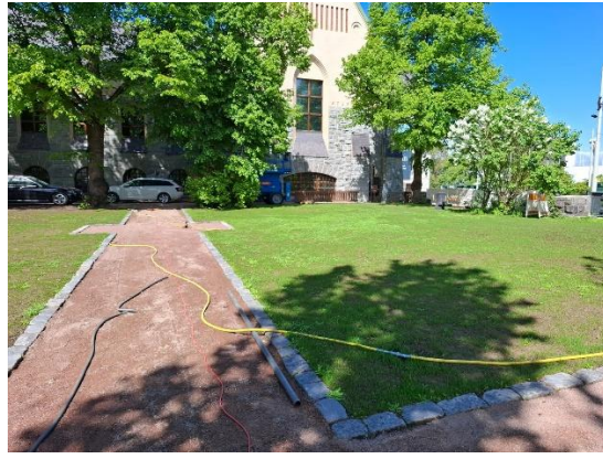
Kuva 2. Pihan ennallistaminen etenee vauhdilla