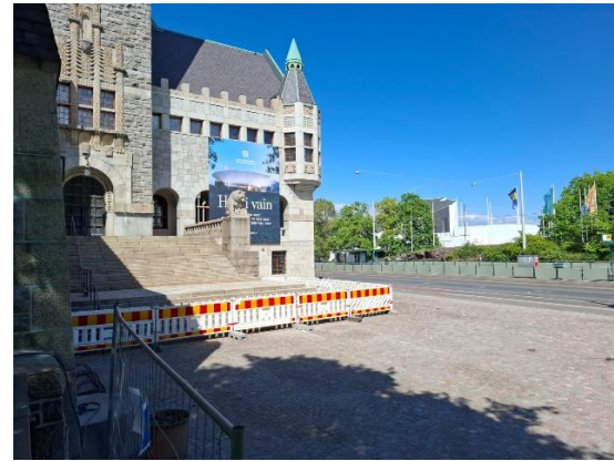
Kuva 4. Aitaukset saatiin purettua Mannerheimintien puolelta

Hyvää alkanutta kesää viikkotiedotteen lukijoille!