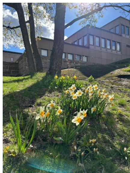
Kuva 1. Keväistä kukkaloistoa Hausenin kukkulan juurella.

Hankkeessa korostuu vastuullisuus. Tavoitteena on parantaa energiatehokkuutta, edistää vähähiilistä rakentamista ja noudattaa kiertotalouden periaatteita. Lopputuloksena syntyy terveelliset, turvalliset ja muuntojoustavat tilat, jotka palvelevat käyttäjiään pitkälle tulevaisuuteen.