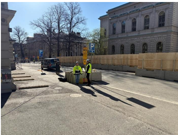
Kuva 2. Työmaan aitausta.

Työmaa-alueen suunnittelussa on huomioitu jalankulkijoiden sujuva ja turvallinen liikkuminen sekä kulkuyhteydet raitiovaunupysäkeille. Työmaan logistiikan vuoksi osa kadunvarsipysäköintipaikoista on varattu työmaan käyttöön, mutta paikat palautetaan yleiseen pysäköintiin heti, kun se on mahdollista.