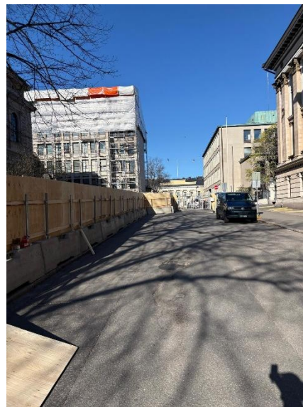
Kuva 3. Työmaan aitausta.

Kansallisarkiston rakennukset suojataan peruskorjauksen ajaksi sääsuojilla. Rakennustelineet ja sääsuojat pystytetään kevään ja kesän aikana. Sääsuojat mahdollistavat rakennustöiden toteuttamisen kuivissa olosuhteissa ja tukevat samalla rakennusaikaista pölynhallintaa.