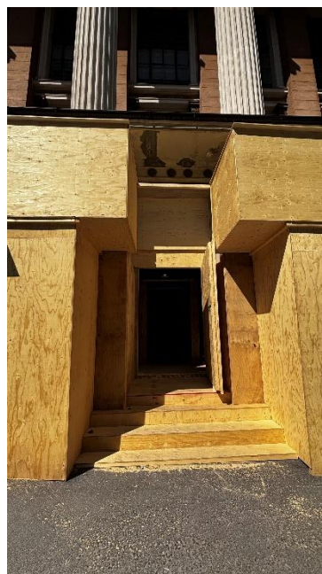
Kuva 4. Päärakennuksen oven edustan suojaus.