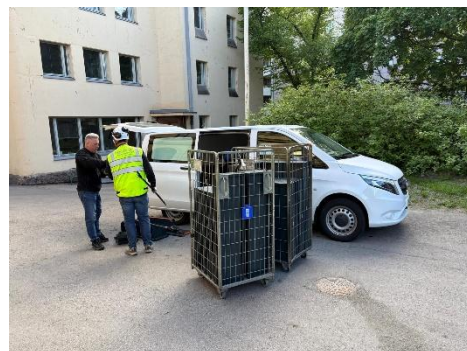
Kuva 2. Myyntituotteiden noutoa.