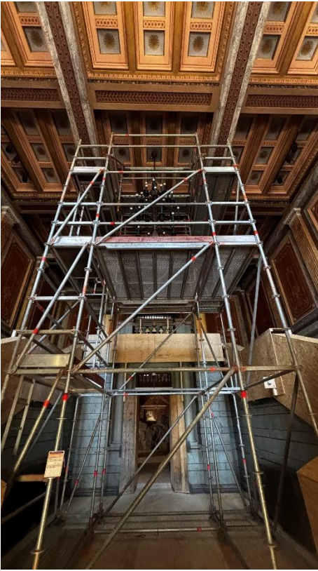
Kuva 6. Telineet kattokruunun poistoa varten.