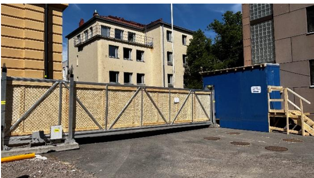
Kuva 1. Kulkuportti 2.

Ensimmäinen erä kierrätettäviä tuotteita on myyty Kiertonetissä, ja tuotteet ovat saaneet uudet omistajat.