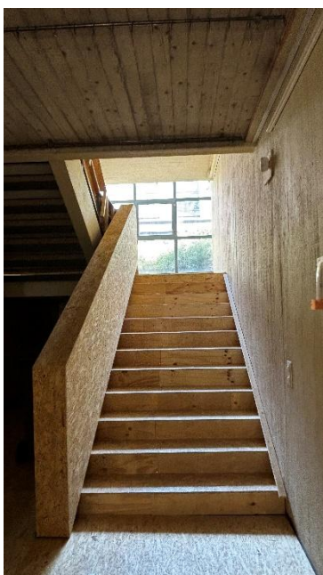
Kuva 3. Suojauksia sisäpuolella.