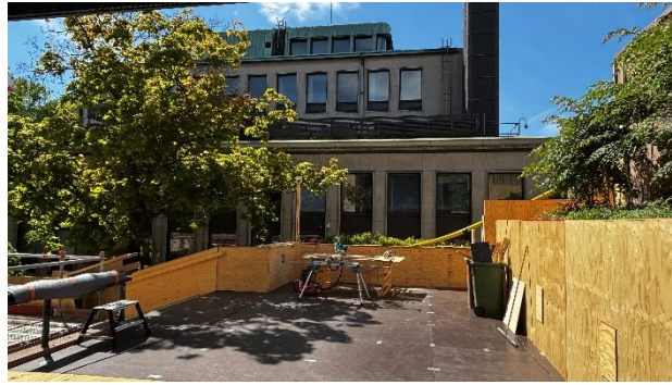
Kuva 7. Haalausreitin rakennusta.