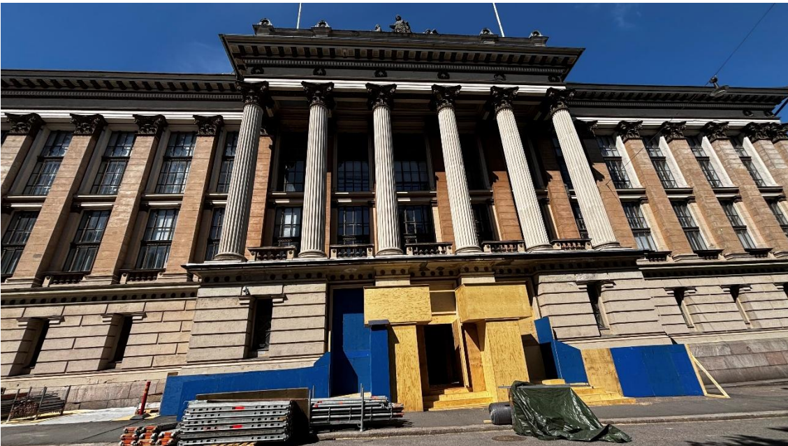
Kuva 9. Vanha päärakennus.