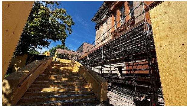
Kuva 8. Haalautason rakennusta ja telineitä rakennushissin pystytykseen.