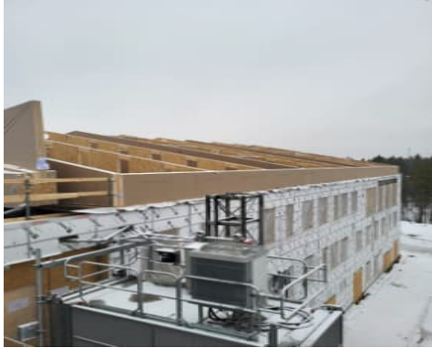
Kuva A-lohkon vesikattoelementtien asennus