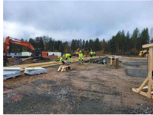
Kuva anturoiden muottityöt käynnissä A-lohkolla