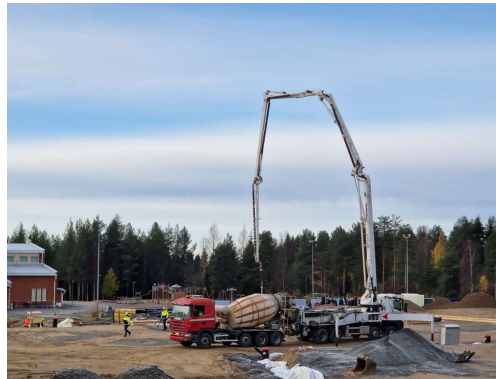
Kuva anturoiden valutyöt käynnissä A-lohkolla