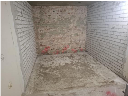
Kuva 3. Vaunuvajan vanhan kylmiöhuoneen lattiavalu Kuva 4. Linnapihalla kaivo on saatu vaihdettua ja kaivanto ummistettua