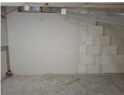
Kuva 5. Silikaatti malli Vaunuvajalla

Urakoitsija: NCC Suomi Oy, vastaava työnjohtaja Erno Immonen, erno.immonen@ncc.fi