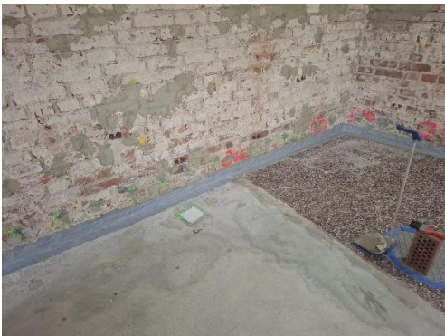
Kuva 1. Vaunuvajan rakenteiden kapselointia