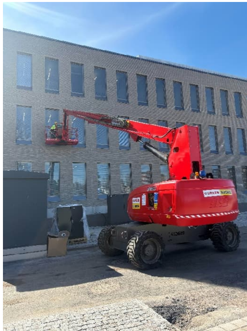
Kuva 3–4. Ikkunapesut ovat käynnissä laajennusosalla.