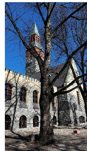
Kuva 1-2. Piha-alueiden ennallistamistyöt aloitettu.