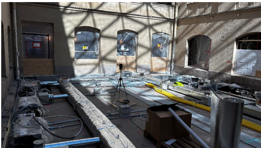
Kuva 3. Talotekniikka-asennuksia Halkopihan lattialla.