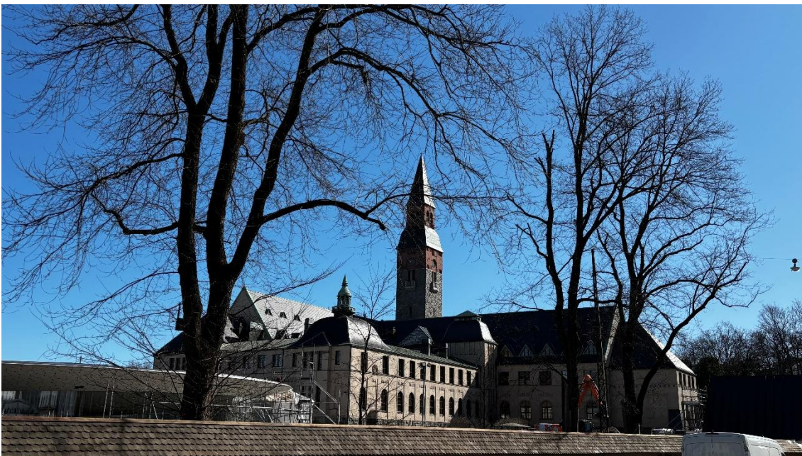
Kuva 6. Suomen Kansallismuseon julkisivu pohjoiseen.

Kansallismuseon peruskorjaustyömaan toimihenkilöt esittävät lämpimät kiitoksensa Tuomakselle tämän merkittävän ja historiallisen hankkeen ansiokkaasta johtamisesta. Hänen antamansa opit ja ohjeet kantavat työn loppuun saakka, ja työmaa saatetaan päätökseen samalla ammattitaidolla ja arvokkuudella.