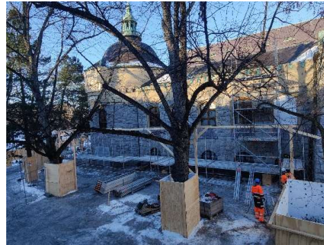
Kuva: Telinetyöt ovat alkaneet viikolla 4 ja etenevät suunnitellusti, 25.1.2024