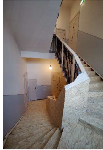
Porraskaskelmia ja kaiteen suojauksia

Työmaan piha-alueen viimeistelytyöt ovat edenneet suunnitellusti, ja viimeiset kyltitykset on asennettu paikoilleen. Työmaatoimiston ja sosiaalitilojen kalustesisustus on myös saatu valmiiksi. Projektin ensimmäinen ulkoinen TR-mittaus on tehty viikolla 3 ja tulos oli huikeat 99,04.