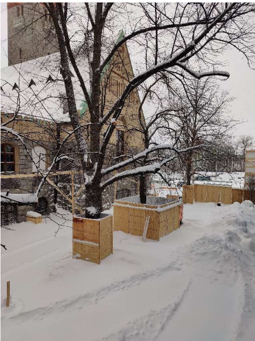
Kuva: Voimakas lumimyräkkä viikolla 3 työllisti lumitöillä, 18.1.2024

Sääsuoja- ja telinetyöt ovat alkaneet näin haasteellisissa olosuhteissa. Työmaa on tehnyt erinomaista työtä hiekoituksen ja lumitöiden parissa, pitäen työmaan ulkoalueen mahdollisimman turvallisina kaikille. On tärkeää, että kaikki työmaa-alueella liikkuvat noudattavat tiukasti turvallisuusohjeita ja käyttävät asianmukaista varustusta liukkailla keleillä. Työturvallisuus on NCC:llä etusijalla, ja jokaisen panos on merkittävä. Tulevina päivinä odotamme säiden tasaantuvan, mutta on hyvä varautua jatkamaan talvisissa olosuhteissa.