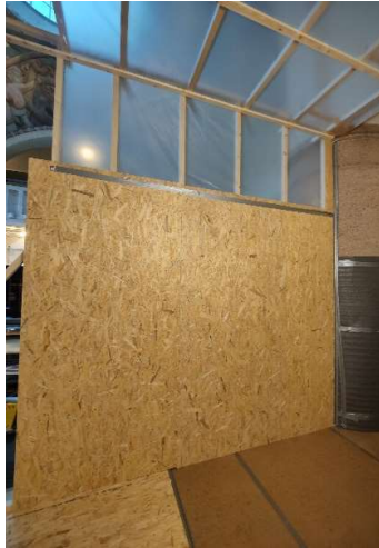
Freskoalueen suojaustyöt käynnissä