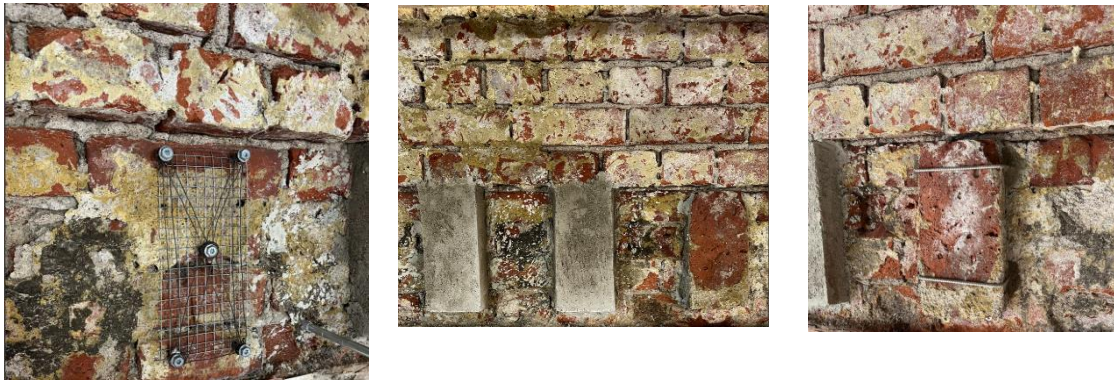
Kuva: Pohjan verkotus ja rapattu hammaskuvio sekä hammastiilen kiinnitys.

Hankkeessa pyritään palauttamaan ja museaaliset arvot huomioiden parantamaan jo olemassa olevien rakenteiden käyttöä. Työmaalla tehdään malliasennuksia, joiden tarkoituksena on varmistaa haluttu työtapa ennen töiden aloitusta. Malliasennusten avulla on helpompi hahmottaa haluttu lopputulos ja tehdä tarvittaessa muutoksia suunnitelmiin. Ne auttavat myös työmaan työvaiheiden suunnittelussa ja työmaan kuluessa malleja tehdään useita. Työmaalle rakennettiin erillinen lämmitetty julkisivun mallialue, johon mallit päästään tekemään hyvissä ajoin ennen varsinaisten työvaiheiden alkua.