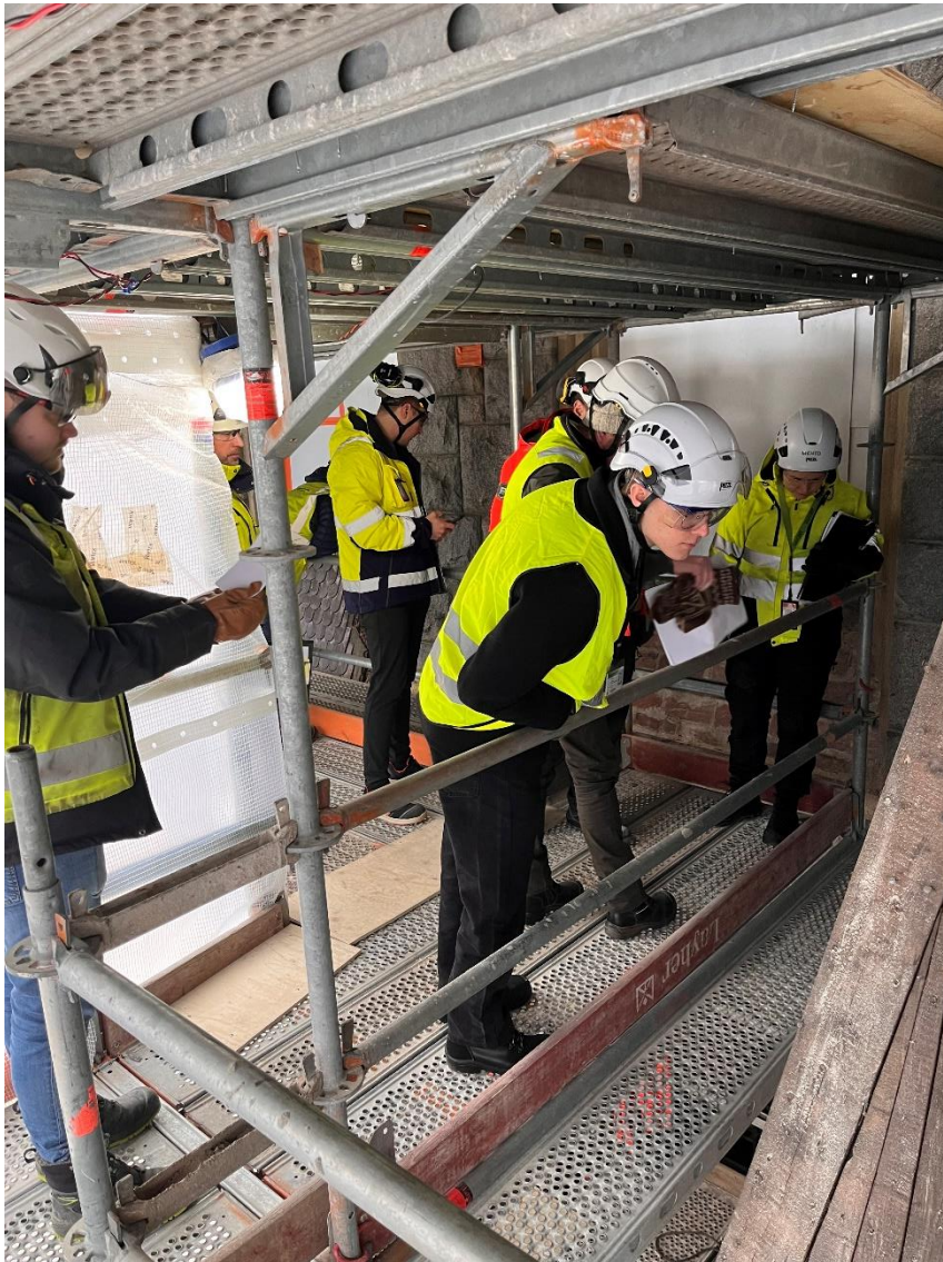
Kuva: Julkisivutöiden alkukatselmus.

Työmaalla pidettiin viikolla 11 julkisivu- ja vesikattotöiden alkukatselmukset. Katselmuksissa arvioidaan ja dokumentoidaan nykytilannetta ja tunnistetaan mahdollisia parannuskohteita. Katselmuksista tehdään raportit, joiden pohjalta työmaa ryhtyy tarvittaviin toimenpiteisiin.