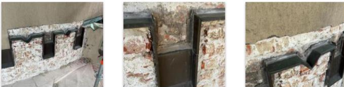
Kuvat: Rappaus purettu julkisivun sakarapeltien ympäriltä. Tarkoituksena on jättää pellit paikoilleen ja tarvittaessa parantaa kiinnitystä.