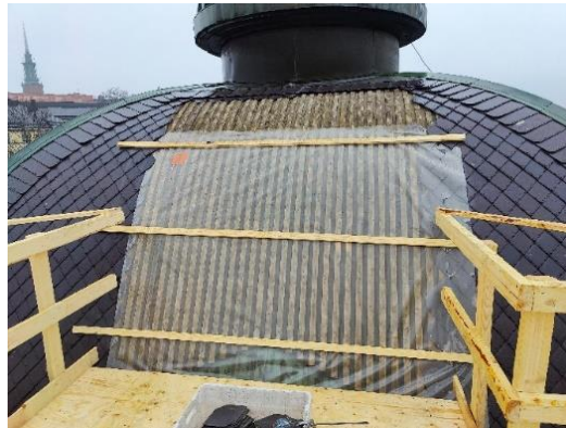
Kuvat: Halkopihan tornin taso.